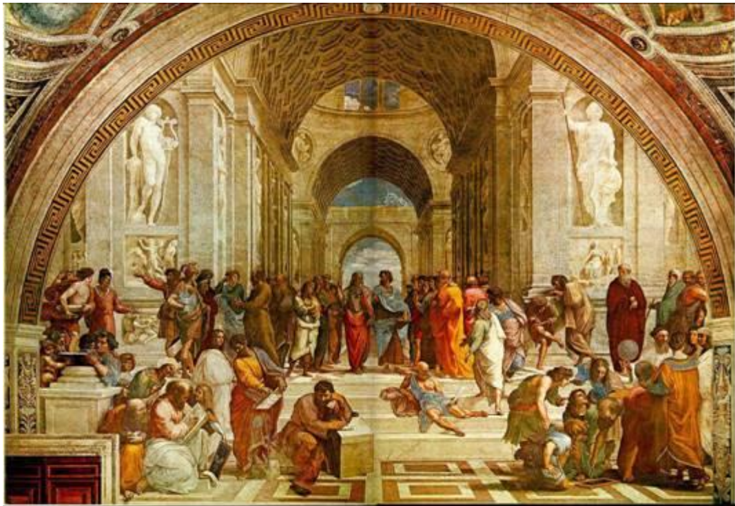
Η Σχολή των Αθηνών, Ραφαήλ