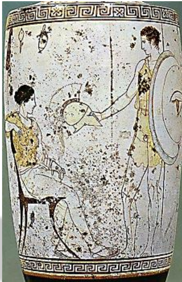
Μισαηλίδη Νίκη, Φιλολογος, Γυμνάσιο Καστρισιού