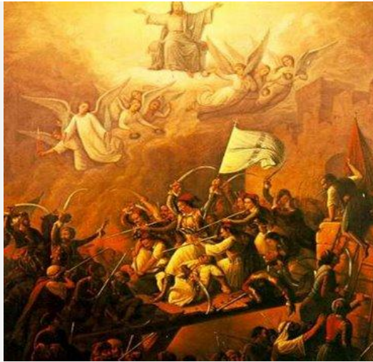
Η έξοδος του Μεσολογγίου

Θέμα : α) Η ομορφιά της ανοιξιάτικης φύσης που καλεί τους Μεσολογγίτες να απολαύσουν τη ζωή, εγκαταλείποντας τον αγώνα τους για Ελευθερία